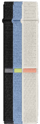
Fabric Band (Wide, M/L)