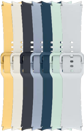
Sport Band S/M | M/L