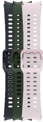
Extreme Sport Band S/M | M/L