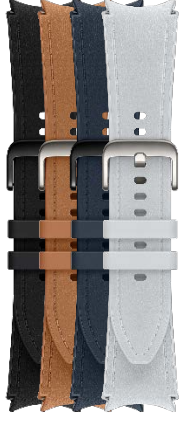
Hybrid Eco-Leather Band S/M | M/L