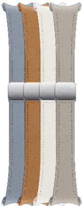
D-Buckle Hybrid Eco-Leather Band (Slim, S/M)