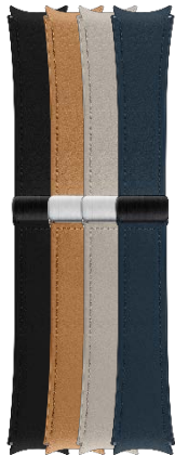
D-Buckle Hybrid Eco-Leather Band (Normal, M/L)