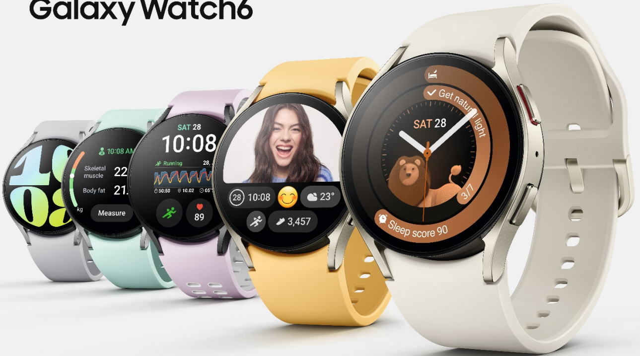
Abbildung simuliert. Farbige Armbänder nicht im Lieferumfang enthalten, sondern separat erhältlich.