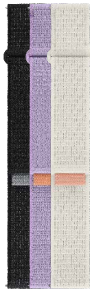
Fabric Band (Slim, S/M)